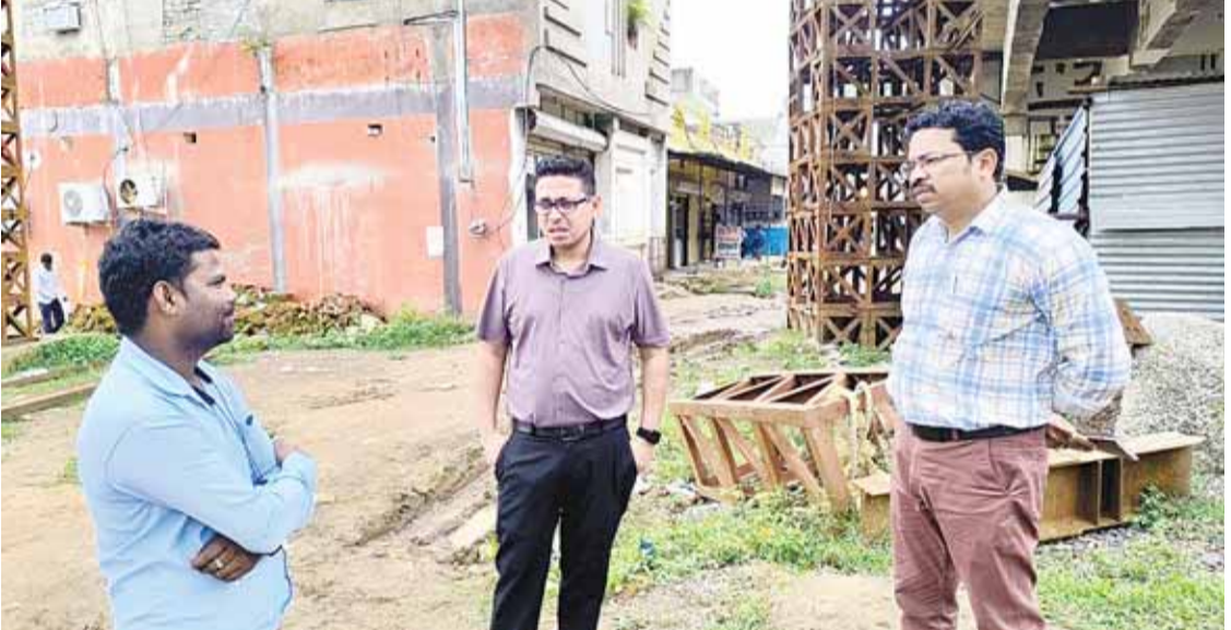
हरिभूमि न्यूज अनूपपुर।

जिला मुख्यालय स्थित रेलवे ओवर ब्रिज (आरओबी) के निर्माण कार्यों की कड़ूप की चाल से एक बार फिर नगर में चर्चाओं का बाजार गर्म है तथा कुछ ही दिनों में पुनः आंदोलन की रूपरेखा तैयार किये जाने के लिए लगातार विचार विमर्श के साथ ही बैठकों का दौर भी शुरू हो गया है। चूंकि कई वर्षों से अपनी पूर्णता की बात जोह रहे ओवर ब्रिज को आज तक पूर्ण रूप प्रदान नहीं हो सका है